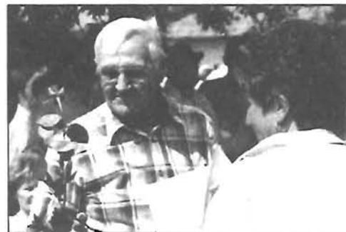
Varjasi és nagylaposi iskoláink emlékére - 1., 3. és 9. oldalak