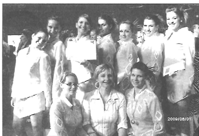
Jókedvűen! A nyolc kategóriában dobogós helyezést elért Színfolt Majorette Csoport a büki Országos Majorette Verseny után

Szíves türelmüket és megértésüket köszönjük! Nemzeti Infrastruktúra Fejlesztő Zrt.