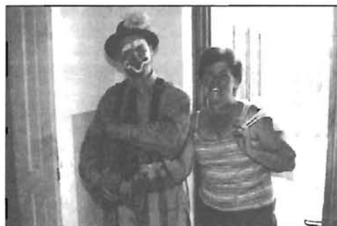
Karitász tábor Hunyán - 12. oldal