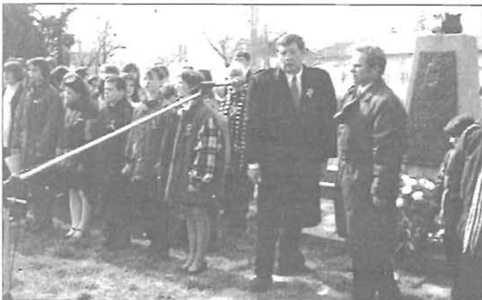
Március 15-én már az új polgármester koszorúzott Endrődön

Zarándoklat Međugorjébe!! Részletek az 5. oldalon!