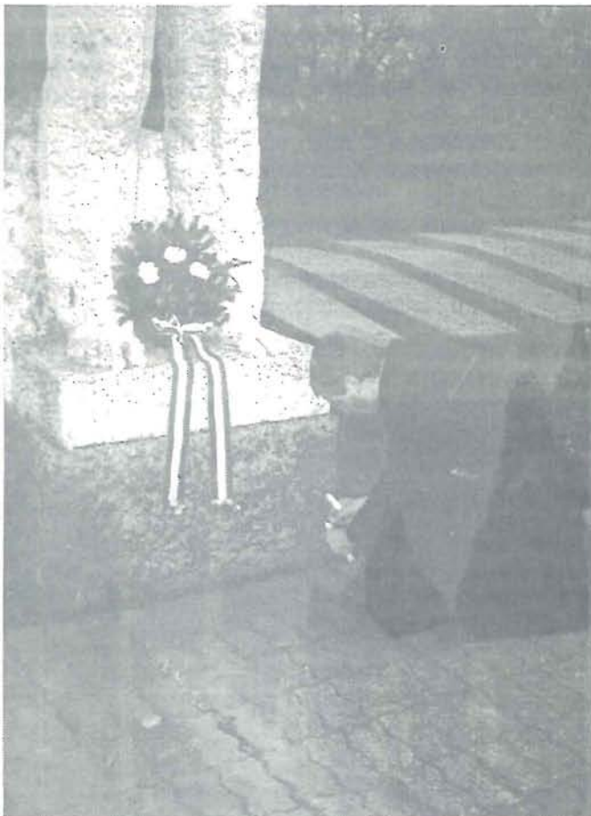
Koszorúzás március 21-én, a csendőrsortüz áldozatainak emlékművénél