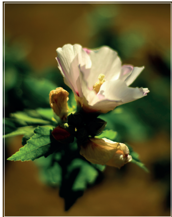
A HÓNAP KÉPE