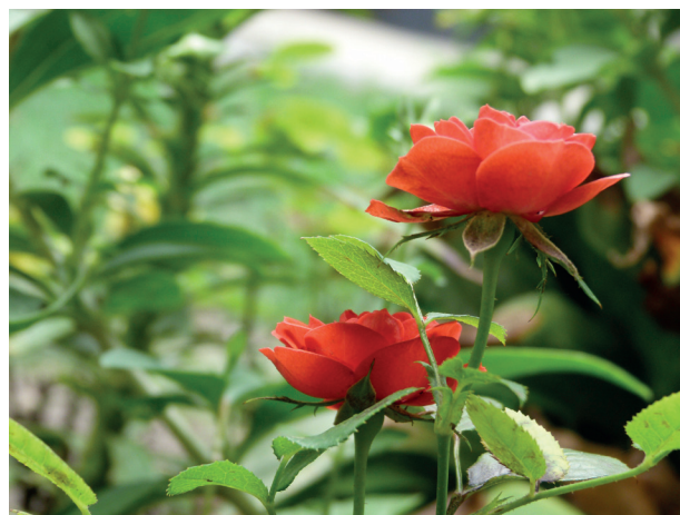
A hónap képe.