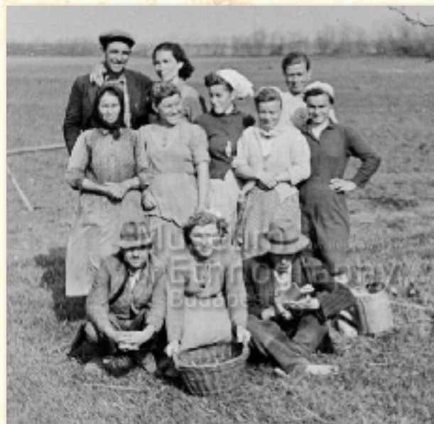
A dohánytermesztő brigád