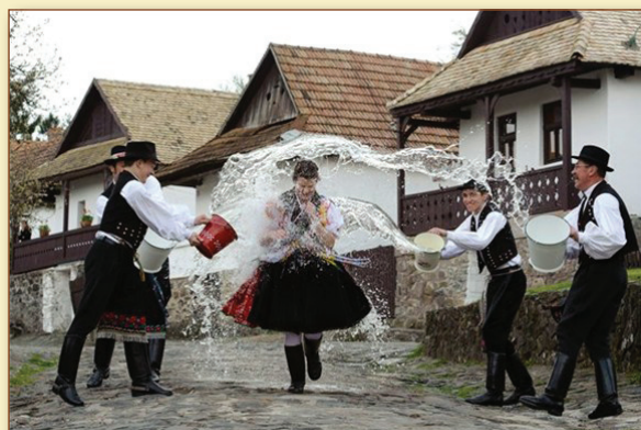
Locsolkodás: 400 éves magyar hagyomány

A szokás arra a legendára is visszavezethető, amely szerint locsolással akarták elhallgattatni a Jézus feltámadását hirdető jeruzsálemi asszonyokat, illetve vízzel öntötték le a Jézus sírját őrző katonák a feltámadás hírére vivő asszonyokat.