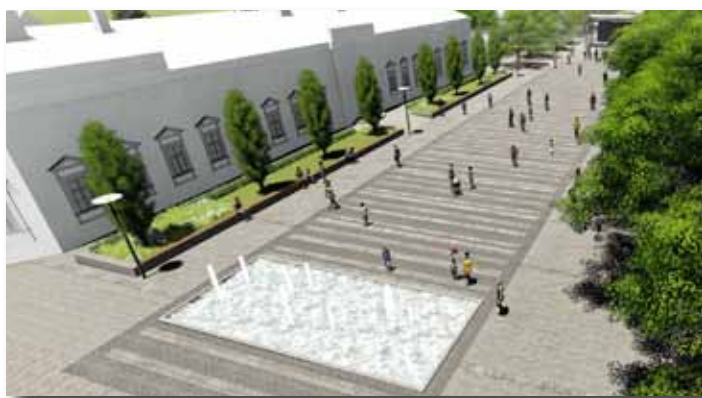
A központi rendezvényter – Főtér