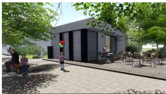
A fagyizóvá alakított épület a Járási Hivatal udvarán