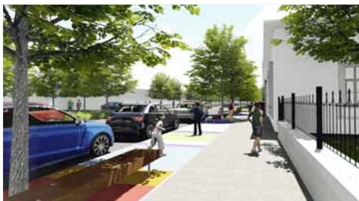
Az iskola előtti kiszállóhely színes, vízáteresztő burkolattal