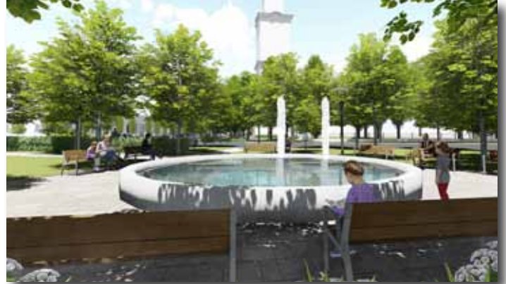
A felújítandó szökőkút körüli teresedés