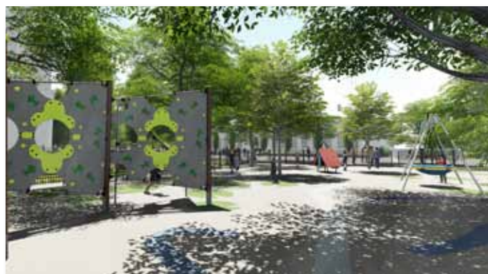
Az iskola udvarán létesítendő játszóter (III. ütem)