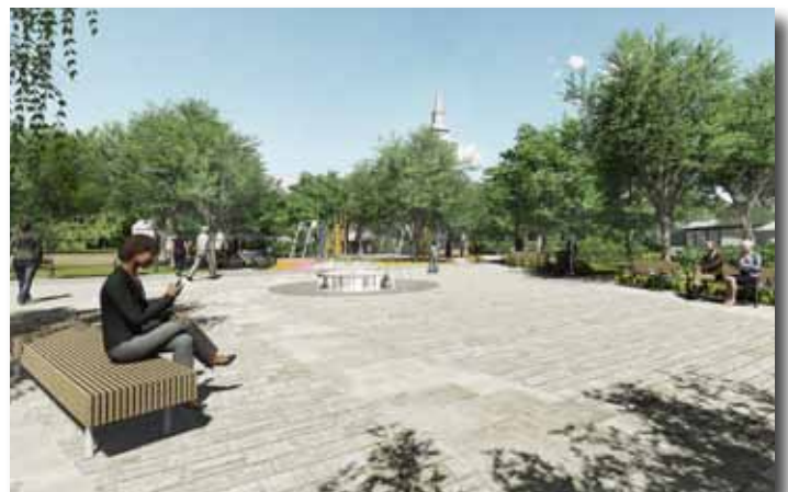
Pihenőtér a csobogóval