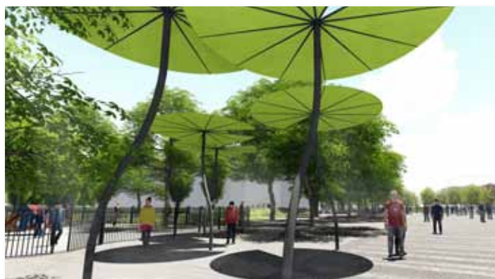
Egyedi árnyékoló elemek