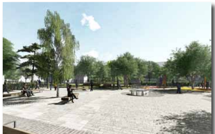
A pihenőtér, háttérben az új játszótérrel