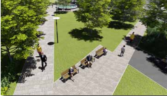
Átkötés a Főtérre, pihenőpadokkal