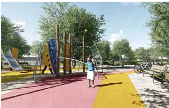
Játszótér, színes gumiburkolattal