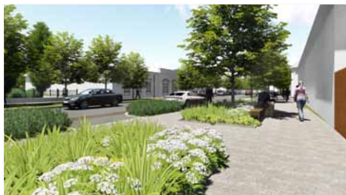
A Hősök útja mentén létrehozott kettős sétány