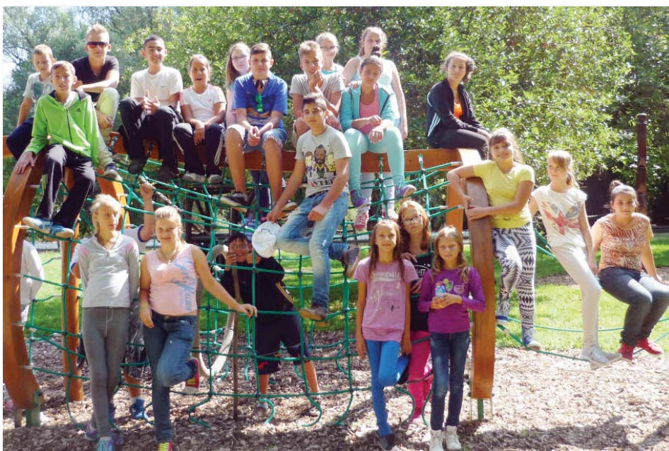
A játszótéri pákaszhalón minden táborozó elfért.

Ezalatt az egy hét alatt tartalmas programokon vettek részt: sétáltak Kecskemét és Baja belvárosában, utaztak kisvasúton a Gemenci-erdőben, Bakódpusztán láttak egy csodálatos lovasbemutatót, sütöttek tökkipompost, végigsétáltak a Kékmoszat tanösvényen és csónakból figyelték a tó élővilágát. Szabadidejükben számháborúztak, nyársaltak, sportjátékokat játszottak, strandoltak és egy izgalmas éjszakai túrán vettek részt. Élményekkel, barátságokkal gazdagodva tértek haza.