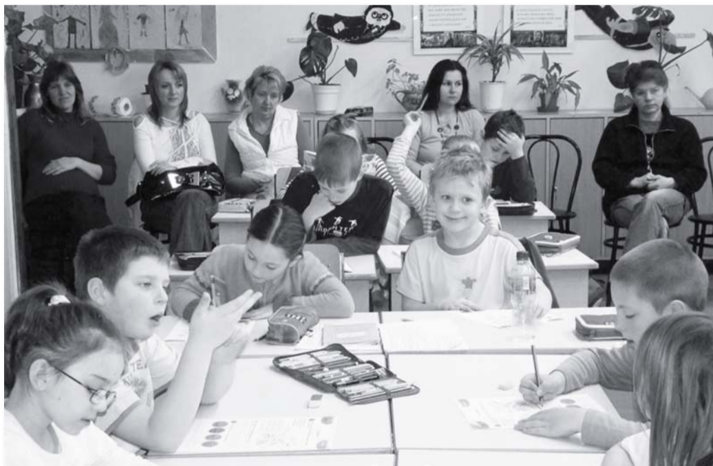
A nyílt napon a szülők a saját szemükkal győződhetnek meg az iskolai munkáról.

A Rózsahegyi Kálmán Kistérségi Általános Iskola Szülői Munkaközössége február 28-án ismét megszervezte a hagyományos jótekonysági vacsoráját a Hídfő étteremben. Joggal érezhetjük, hogy igen sikeres és vonzó esemény volt, hiszen több mint kétszáz vendég vett rajta részt.