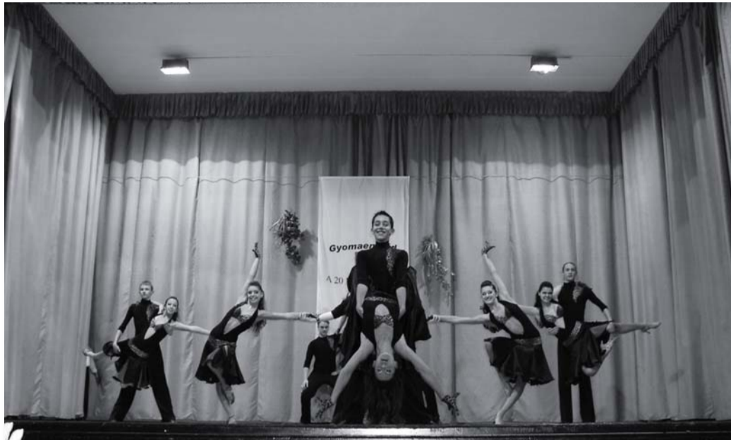
Látványos műsort adott a Kner Táncsport Egyesület