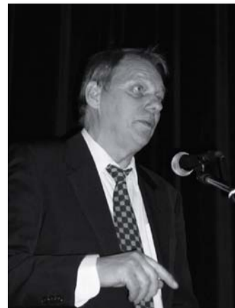
Sággy Gyula rendező filmjével közelebb hozta a nézőkhöz Kállai Ferencet, a művészt és az embert.

Egy jó évvel ezelőtt határozta el a képviselőtestület, hogy a várossá avatás 20. évfordulójára Sággy Gyulával elkészítse