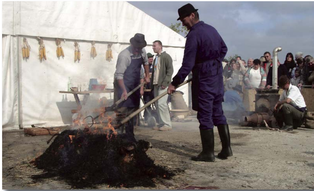
Az érdeklődők közül a legtöbben most láthattak először szalmás perzselést.