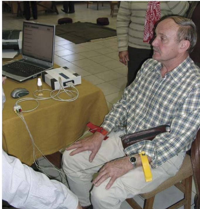
A helybeni ingyenes szűrővizsgálat lehetőségét sokan kihasználták, népszerű volt a stressz-szűrés is.