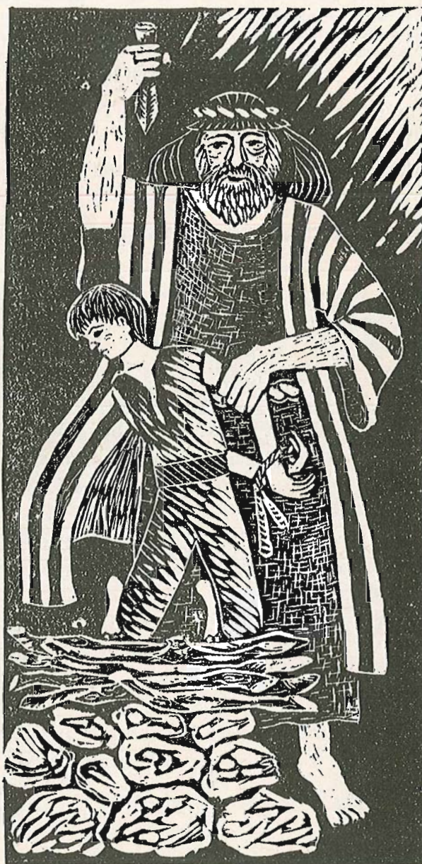
Véha Tímea: Ábrahám áldozata (linómetszet)