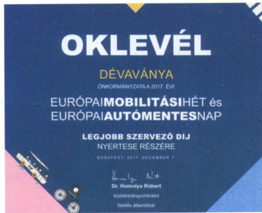
Elismerésben részesült városunk önkormányzata