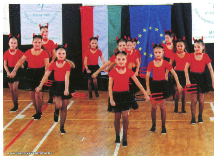
A déványai Amethyst mazsorett csoport országos versenyen különdíjat nyert