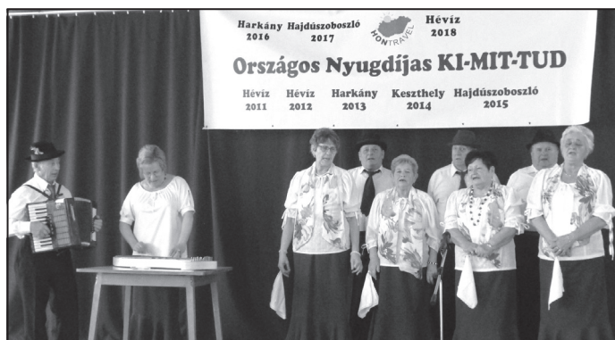
Az Őszi Napfény Nyugdíjas Egyesület a VIII. Országos Nyugdíjas Ki-Mit-Tud rendezvényen továbbjutott a középdöntőbe Hévízre.