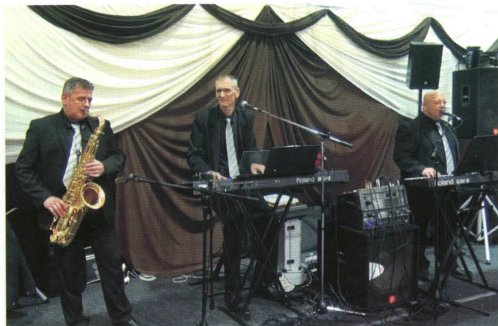
XII. Óvodai alapítványi bál