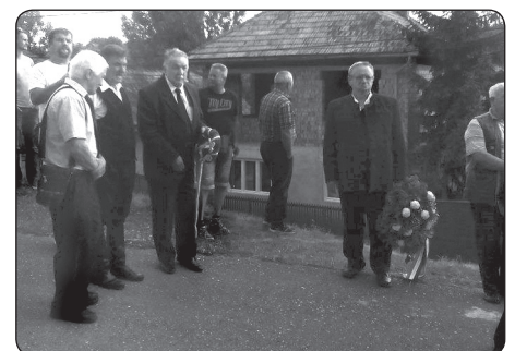
Koszorúzásra várakozva – Körösfő: 2017. július 8.

Az elismerések átadását követően a Körösfő testvértelepülései, a pestszentlőrinci Vasvári Pál Polgári Egyesület, a tiszavasvári Vasvári Pál Társaság, a nyírvasvári Vasváriak Vasváriért Közéleti Egyesület mellett, mint Békés megyei Vasvári-kutató helyeztem el közösségünk emlékkoszorúját.