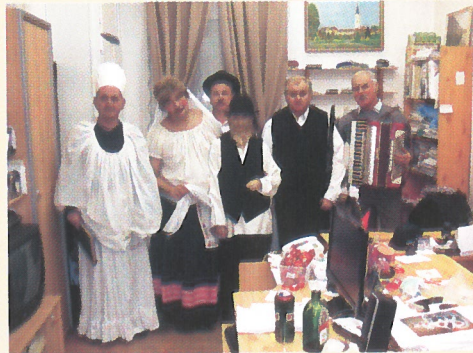
A tréfás lakodalom szereplői és zenészei