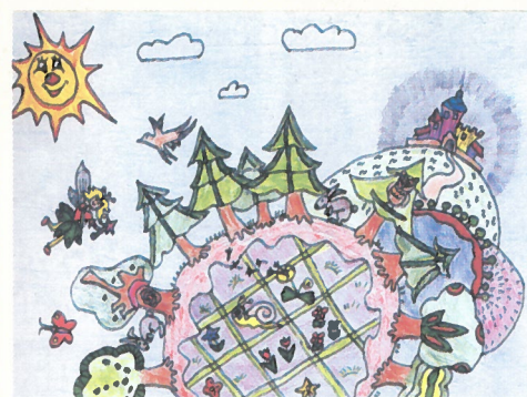
A Fiatalok Közössége Szeghalomért Egyesület pályázatának különdíjas alkotása