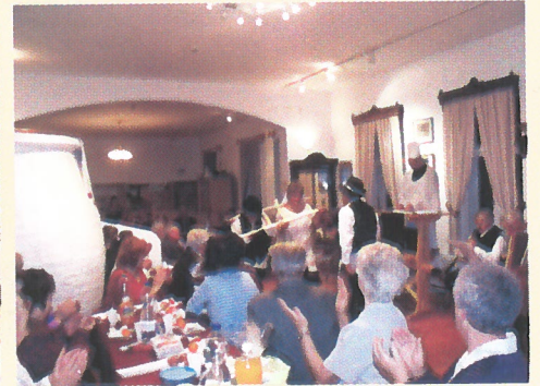
Részlet A tréfás lakodalom című műsorból