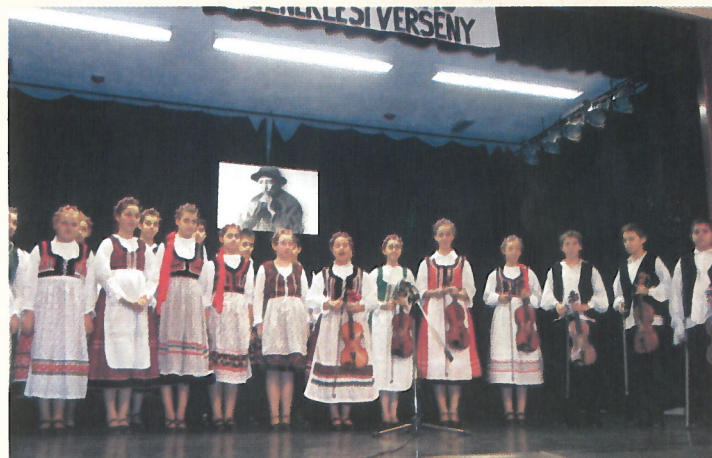
II. Kádár Ferenc Népdaléneklési Verseny