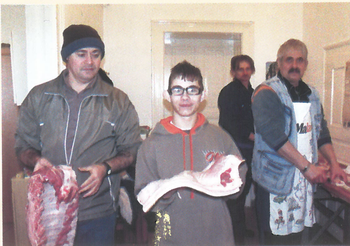
Disznótöröztak a Dévaványai Nagycsaládos Egyesület tagjai