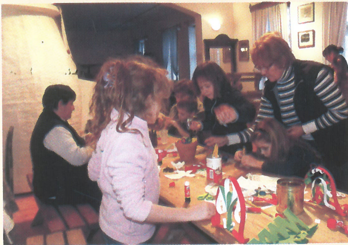
Nagymamák és unokák közösen kézműveskedtek a múzeumban Luca napján