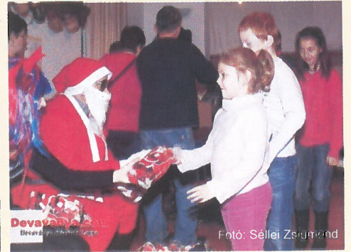
A Dévaványai Nagycsaládos Egyesület mikulás bulija a múzeumban