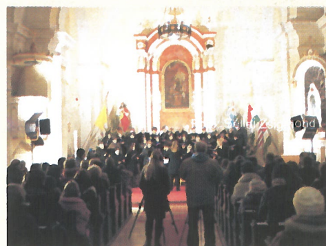
Karácsonyi koncert a Szent Anna Katolikus Templomban