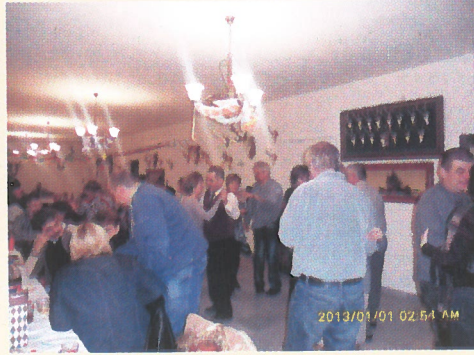
A Dévaványai Nagycsaládos Egyesület szilveszteri bulit rendezett a Vadászházban