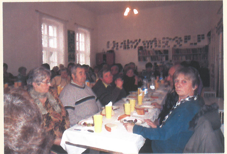
Békés Megyei Mozgáskorlátozottak Egyesülete Dévaványai Szervezete első közös karácsonya