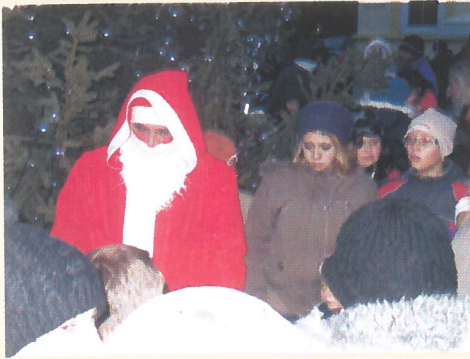
Ellátogatott a Mikulás a városi fenyőfához