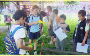
Sok résztvevővel, jó hangulatban telt a Nagycsaládok