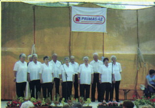
A XIII. Országos és Nemzetközi Nyugdíjas Találkozón járt a nyugdíjas klub