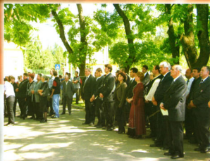
Felavattuk a Trianoni emlékművet

DÉVAVÁNYA VÁROS ÖNKORMÁNYZATA TÁJÉKOZTATÓ LAPJA 2010. július 2.