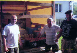
Adomány az árvíz sújtotta településeknek