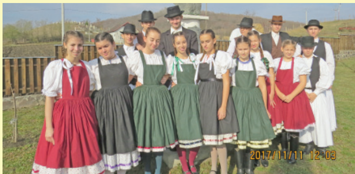
A néptáncosok a Marosludas melletti Andrásytelepen részt vettek Andrassy Gyula szobrának koszorúzásán

A néptáncosok nyolc párral, az úrhidai önkormányzat támogatásával utaztak Marosludásra. A fesztivált a művelődési ház hatalmas színháztermében rendezték (óriási színpad és 600 fő fölötti nézőtér). A fesztivál résztvevői a helyi és környékbeli települések néptáncosportjai és énekesei, valamint a testvértelepülések képviselői voltak. Életkor szempontjából is színes volt a paletta, hiszen az 6-7 éves kisgyerekektől a nyugdíjasokig minden korosztály képviseltette magát.