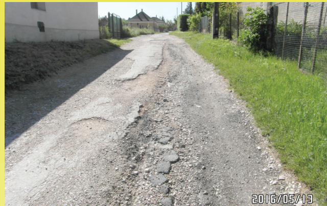
Harangvirág utca a tavaly májusi felhőszakadás után.

A Képviselő-testület az elmúlt két évben sikeresen pályázott az adóssághozzájárulásban részt nem vett települési önkormányzatok fejlesztési támogatására, valamint két ütemben a nagy esőzések miatt életveszélyessé vált utak felújítására. Az elnyert közel 100 millió forint támogatás mellett, az önkormányzat 30 millió forint önerő vállalásával közel három kilométer út kap aszfaltborítást és a település elején folytatódik a járda építése.