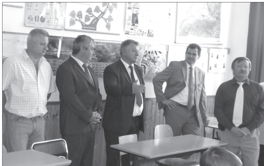
Törő Gábor Országgyűlési Képviselő, több alkalommal járt az iskola épületében.

A KÖZÖSSÉGI HÁZ avató ünnepségét követően V. Német Zsolt Vidékfejlesztési Minisztérium, Vidékfejlesztésért felelős államtitkára megdöbbenve ált az épület láttán.