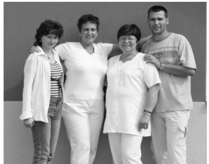
A PROSYS GYÓGYSZERTÁR CSAPATA