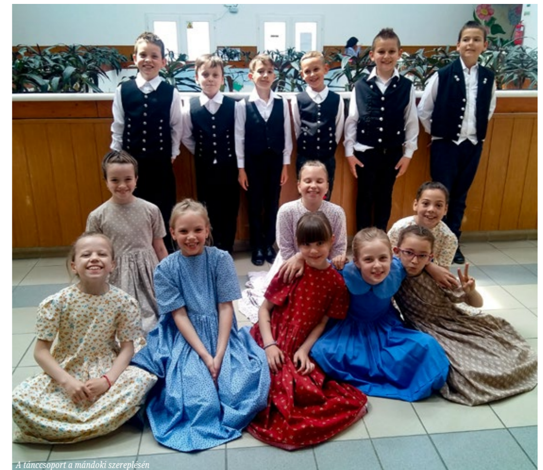
A táncsoport a mándoki szereplésén