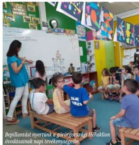
Bepillantást nyertünk a görögországi Heraklion óvodásainak napi tevékenységeibe.