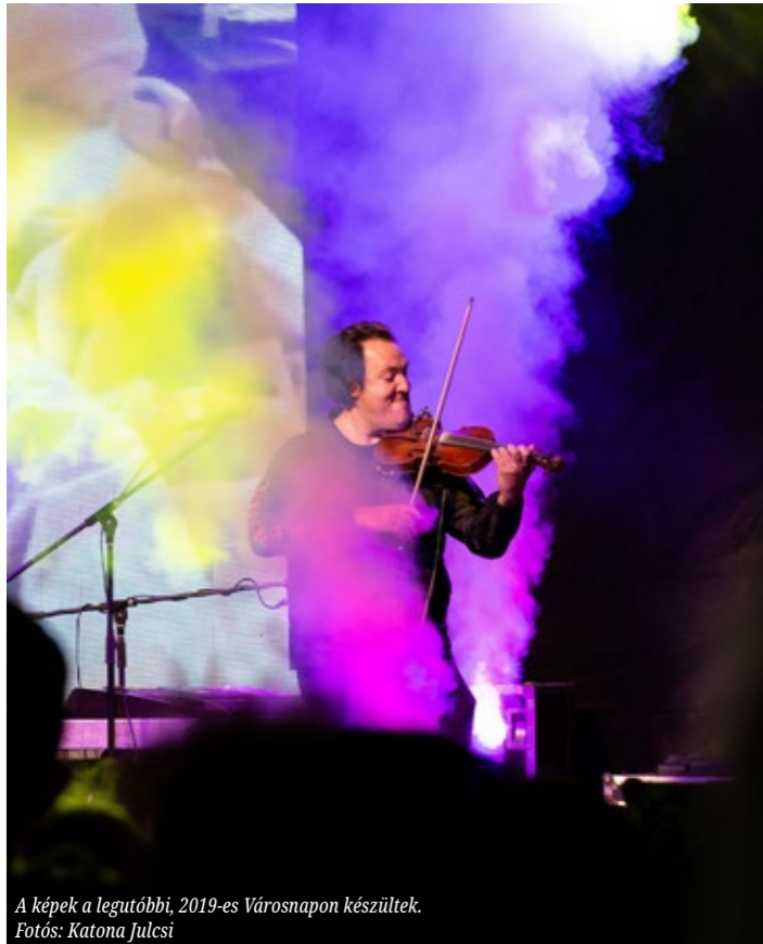
A képek a legutóbbi, 2019-es Városonapon készültek.

A 2004 óta eltelt tizenhét év alatt számtalan feladatot és rengeteg munkát sodort elének, melyek – az itt élő sok-sok ember támogatásával – közösen elért eredményekké váltak. A dolgos mindennapok szülte sikereket, ezt a folyamatos városépítő munkát épp ezért együtt illik ünnepelni, és újra együtt örülni a megvalósult álmainknak és újabb céljainknak.