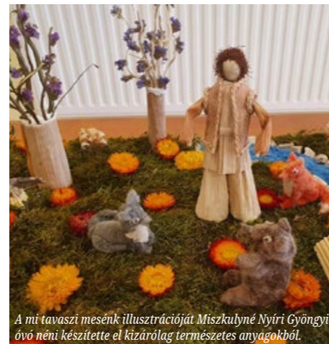
A mi tavaszi mesénk illusztrációját Miskulymé Nyíri Gyöngyi óvó néni készítette el kizárólag természetes anyagokból.