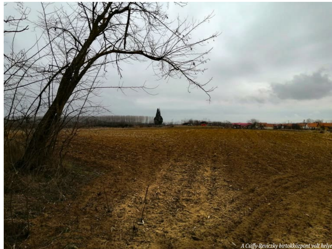
A Csiffy-Reviczky birtokközpont volt helye