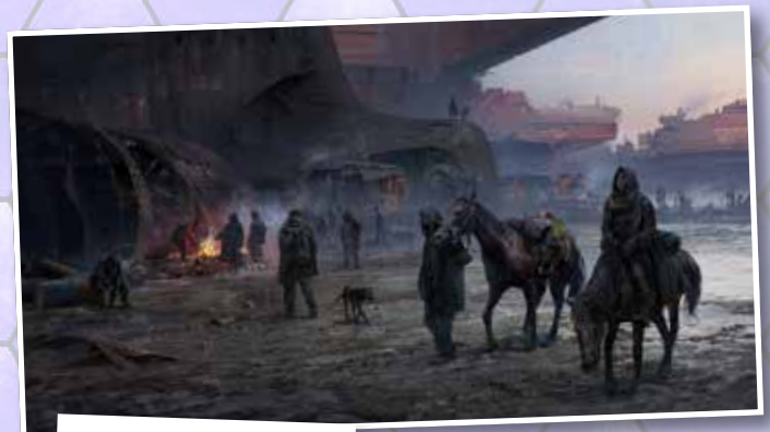
Wreckage Riders 2