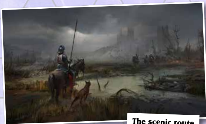
The scenic route