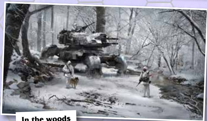
In the woods