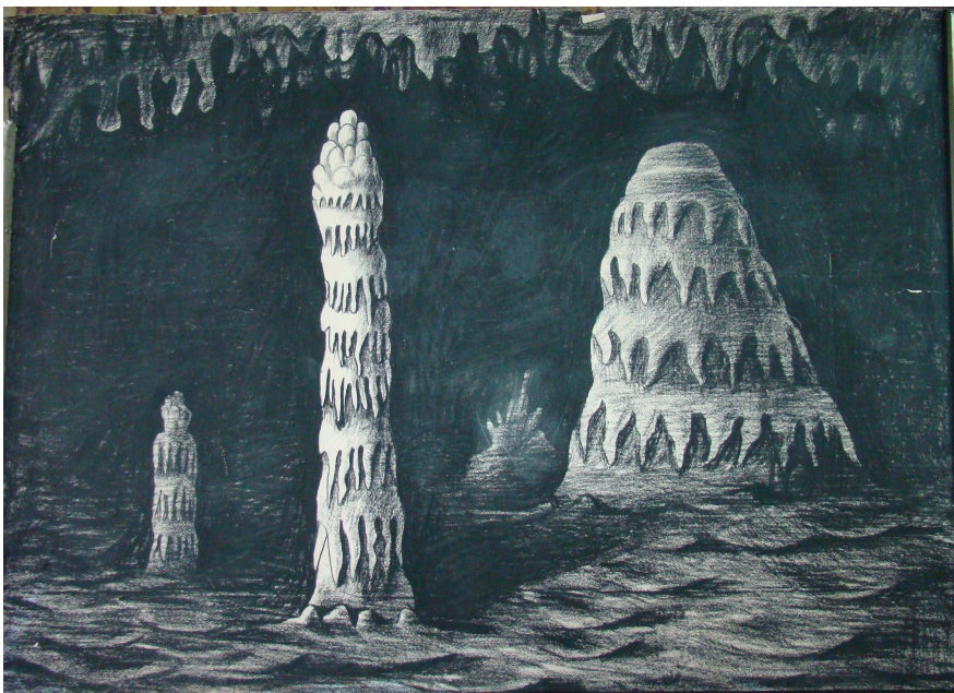
Dávid és Góliát, Bábel tornya a József főherceg-barlangban