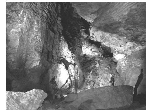
A Veronika-ág egyik terme

A Szabó József Barlangkutató Csoport által, a Budai-hegységben végzett, több mint 5 éves feltáró kutatás eredményeképpen 2009. november 25. és 2010. január 21. között sikerült új részeket feltárni a Hideg-lyuk barlangban (4762/41). A megtalált járatok felmérése és fotódokumentálása folyamatban van. Az új részek hossza meghaladja az 1,5 km-t, és magyar viszonylatban jelentős méretekkel bírnak. Ezekkel a járatokkal a barlang teljes hossza elérheti a 2 km-t. Emellett reális esély mutatkozik a közelben található Harcsaszájú-barlanggal való összeköttetés megismerésére is. Ha ez sikerül, a járatok hossza meghaladhatja az 5 km-t.