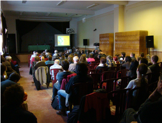
Folynak az előadások a jószaói kultúrházban

sok tartalmának ismeretében megállapíthatjuk, hogy külföldön jelentős eredményeket