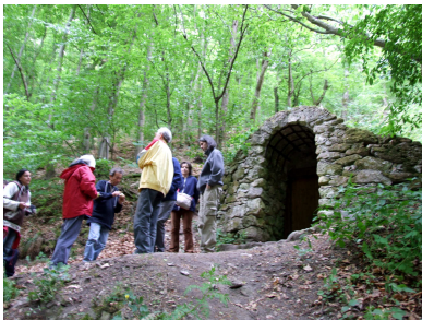
Csoportunk a Telkibányai „jégbarlang” előtt

Túránk kiinduló pontja Miskolcon a Tiszai pályaudvar volt, ahonnan meglehetősen kellemetlen időjárási viszonyok (szél, teljesen borult égbolt) mellett indultunk el Telkibánya felé. Útközben az eső is eleredt, ezért némi programváltoztatás után úgy döntöttünk, hogy elsőként a „jégbarlangot” keressük fel. Szerencsére még az indulás előtt sikerült kinyomozni a barlangkulcs fellelési helyét. Így a telkibányai erdészettől megszerzett kulcs birtokában be is jutottunk a tárba, ahol a szokatlan enyhe tél következtében természetesen egyetlen jégképződményt sem láttunk. Mivel a felhőjárás némi reményre engedett okot, a