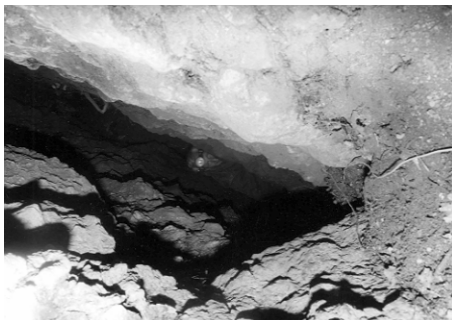
A Dornyay-barlang bejárata

szénréteg következtében 1917-ben keletkezett bányaomlás által alakult 600 m hosszú, 1—2 méter széles és 10—15 m mély hasadékrendszer, melyből a barlangok zöme is nyílik. A résztvevők a Dornyay-barlang előterében emléktáblát avattak, méltatva és elismerve a névadó elévülhetetlen munkásságát. Majd számosan alászálltak a legjelentősebb barlangokba: a Szilvás-kői-barlangba és a Sárkánytorok-barlangba, a többi barlangnak pedig megnézték a bejáratát.