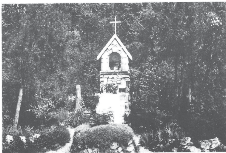
11. ábra A bószobi Burda-féle kápolna