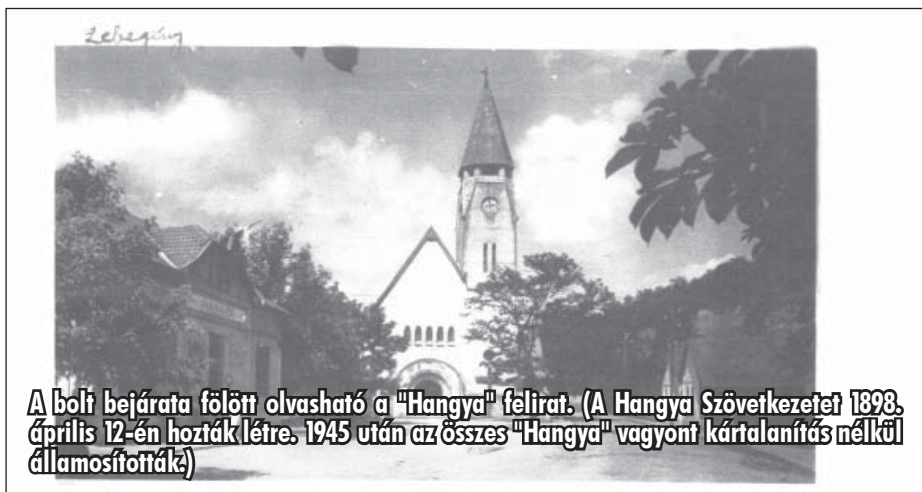
A bolt bejárata fölött olvasható a „Hangya” felirat. (A Hangya Szövetkezetet 1898. április 12-én hozták létre. 1945 után az összes „Hangya” vagyont kártalanítás nélkül államosították.)

Egy kis érdekesség „Csanádról piros almát, Makóról vörös hagymát, Selmeci pipát hosszú szárút, A „HANGYÁ”-ból minden árút. „