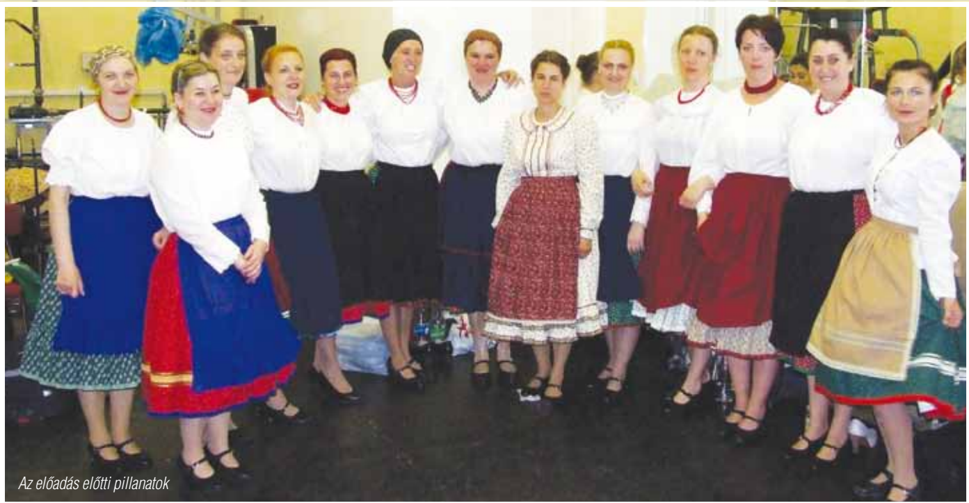
Az előadás előtti pillanatok