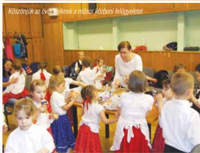
Köszönjük az óvodásoknak a műsor közbeni felügyeletet

“Oda menjünk, ahol kellünk, ahol nekünk öröm lennünk!”