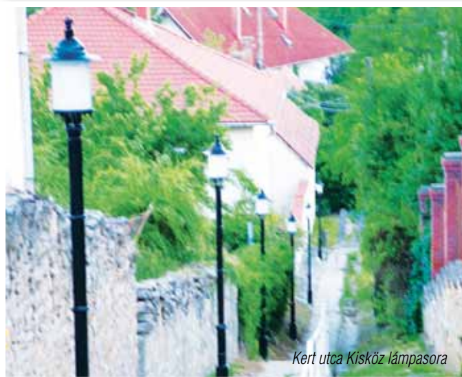
Kert utca Kisköz lámpasora