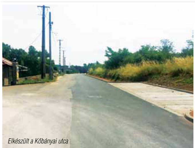
Elkészült a Kőbányai utca

Sor került a kátyúzások és egyéb munkálatok elvégzésére. 2,6 fm-en szegély lerakása történt meg, fedlapok szintbe hozása, illetve a szükséges kátyúk javítását végezte el a kivitelező.