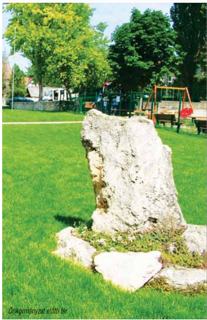
Önkormányzat előtti tér

Elkészült, így a nyári fesztivál színtere már a felújított tér volt. A közel 3000 m 2 -es tér új zöldterületet, térburkolatot kapott, továbbá a parkban meglévő cserjék, fák megújítása is megtörtént. Miután a megújított tér zöldterülete igen jelentős, így takarékosági megfontolásból is az öntöző rendszer ácsolt kútra lett rákapcsolva. A tér elkészülte óta eltelt idő tapasztalatai azt mutatják, hogy lakótársaim szívesen időznek a parkban és otthonosan birtokba vették ezt az új zöld területet.