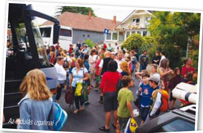
Az indulás izgalmai