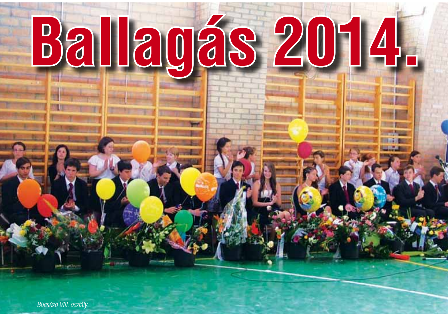
Búcsúzó VIII. osztály

A tanév utolsó napján az itteni hagyományoknak megfelelően sor került az évről utáni ballagásra. Ebben a tanévben 13 végzős diák búcsúzott az iskolától. A ballagási ünnepségen a „főszereplők” a ballagók mellett megjelentek szüleik, hozzátartozóik és az iskola valamint az önkormányzat vezetői és az egyházak képviselői.