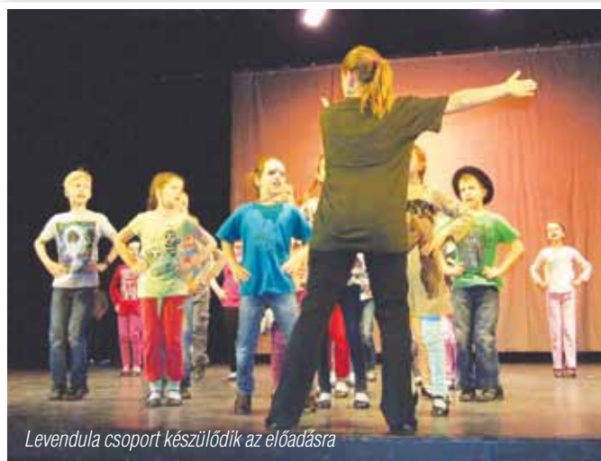
Levendula csoport készülődik az előadásra