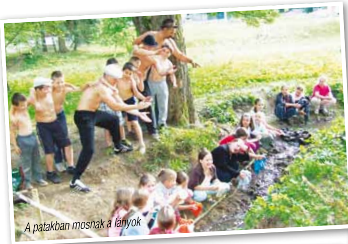
A patakban mosnak a lányok