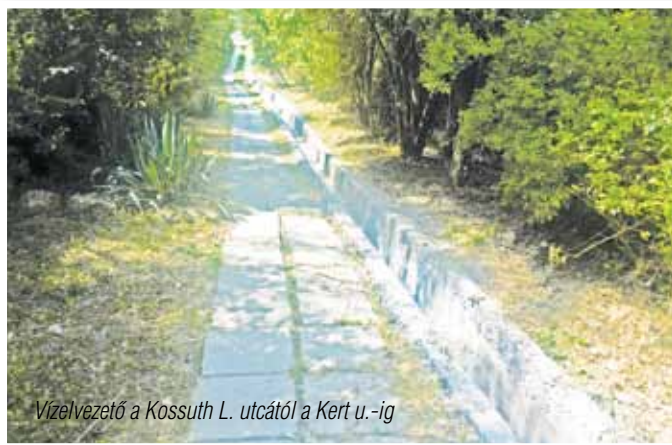
Vízvezető a Kossuth L. utcától a Kert u.-ig