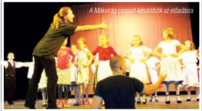
A Mákvirág csoport készülődik az előadásra