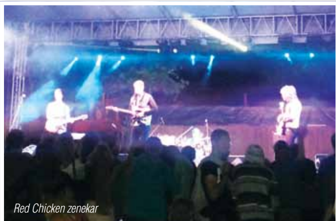
Red Chicken zenekar

A Napraforgó óvoda évzárója után az Ürömi Öröm Néptáncműhely gyermekcsoportjai léptek fel, a legtöbb csoport táncolt.