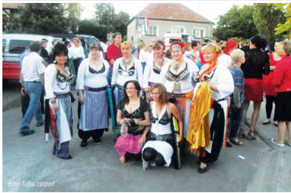
Emel Tribal csoport

énekeltek komplett zenekari kísérettel. A közönség őket többször visszatapsolta.