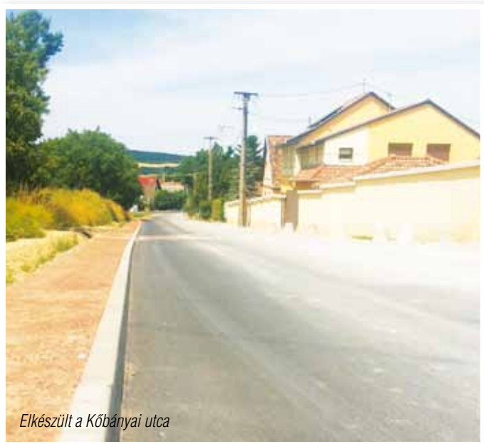
Elkészült a Kőbányai utca