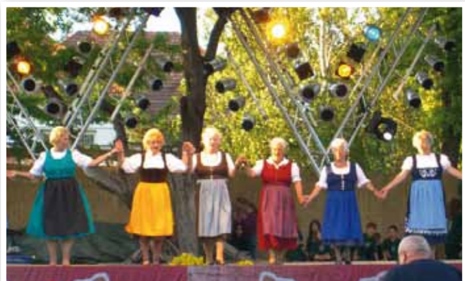
Fellépés a X. Nyári Fesztiválon