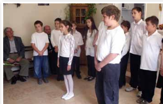
Iskolások ünnepi előadása

Ha Isten meghallgatta imád, S az égből áldást küldött le rád, Ne tartsd meg csak magadnak, Míg mások sírnak, jajgatnak. Add tovább!