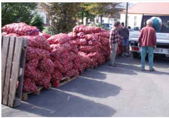
A krumplihordó önkéntesek (szerk.)

Összegezőképpen talán még érdemes megemlítenem, hogy az 1200 támogatott lakótársunk közül mindössze 3 fő utasította vissza a támogatást, 21 család pedig közéleti célokra ajánlotta fel.