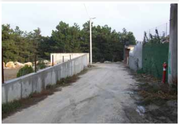
Fagyöngy utca kandalábere

Útalapjavítás, erősítés, kopóréteg készítés 4+1 cm vastagságban 475 nm-en nemesített padkakészítése 190 nm-en történt.