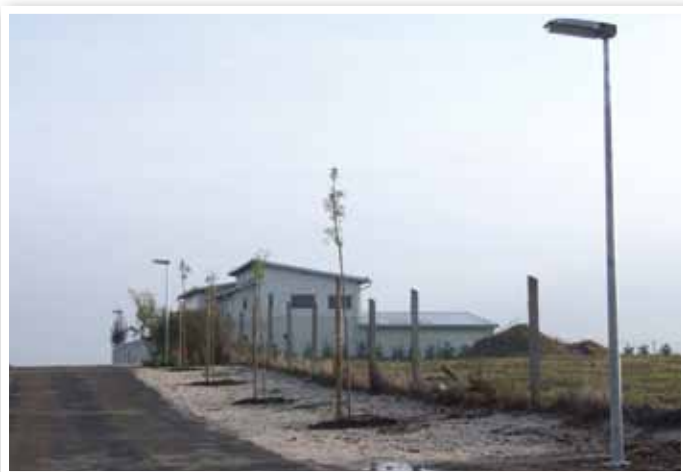
Kormorán utca kandaláberei

4+1 cm vastagságban 1550 nm-en történt, valamint nemesített padka készítése valósult meg 190 nm-en.