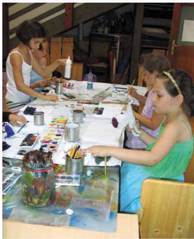
2009 művészeti alkotótábor