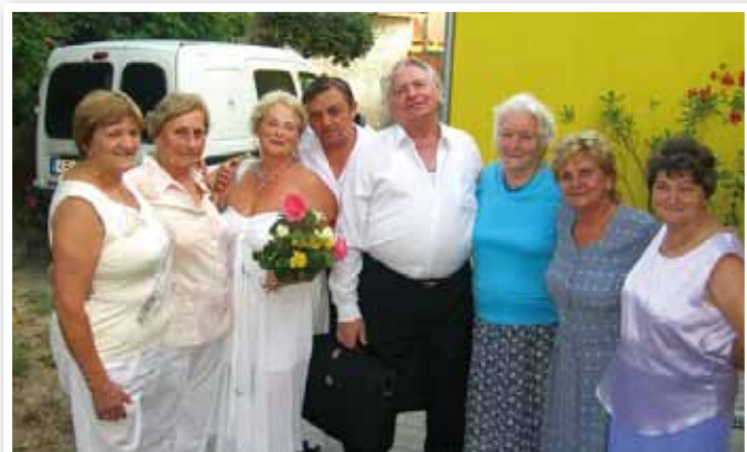
Csoportkép a fellépő művészekkel