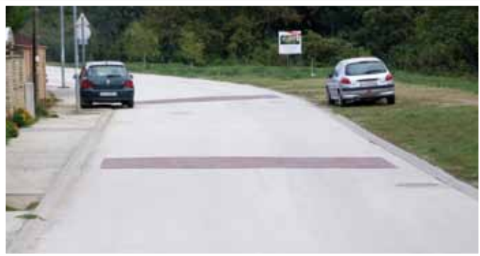
Gábor Áron sétány fekvőrendőr

• 2 db forgalomcsillapító küszöb készült el a Gábor Áron sétányon az ott lakók anyagi finanszírozásában, amelyet ezúton is megköszönök a támogatóknak. Önkormányzatunk igyekszik a legégetőbb lakossági igényekre is odafigyelni és lehetőségeihez képest a kezdeményezéseket felkarolni, de anyagi lehetőségeink nekünk is