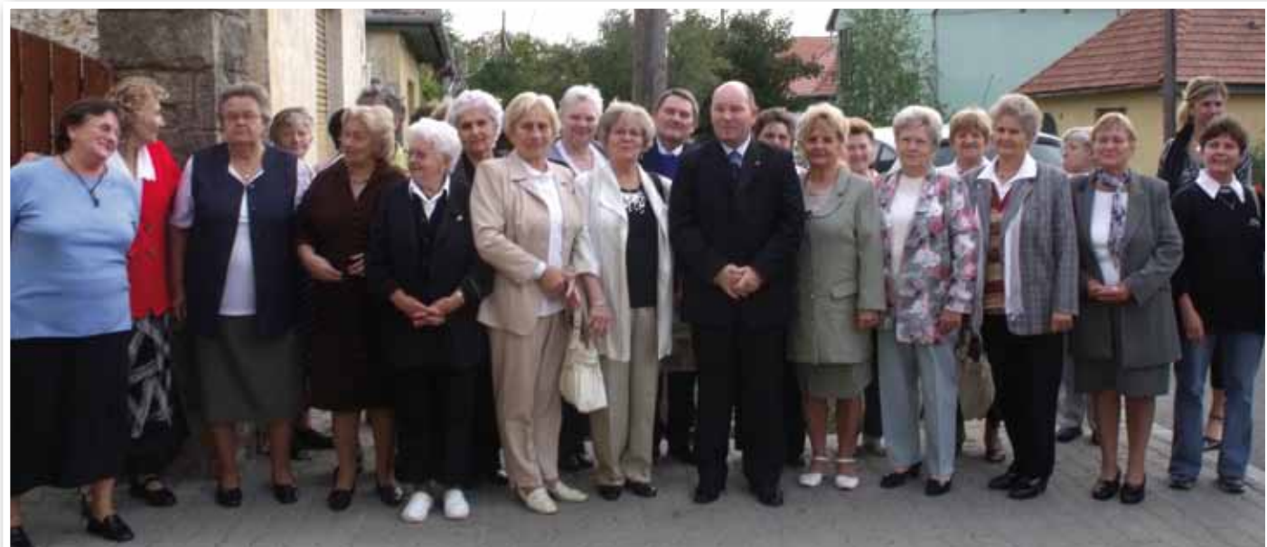
Az ünnepség résztvevői

Az intézményünkben működik Családsegítő szolgálat és Házi segítségnyújtó szolgálat, továbbá helyet biztosítunk az önszerveződő csoportoknak /Nosztalgia Klubnak és az Ürömi Hagyományörző Egyesületnek /