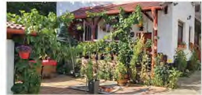
Budainé Kollár Erzsébet