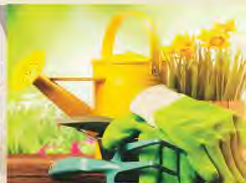
LEGSZEBB KONYHAKERT ÉS VIRÁGOS ÓCSÁÉRT PÁLYÁZATOK 19. OLDAL