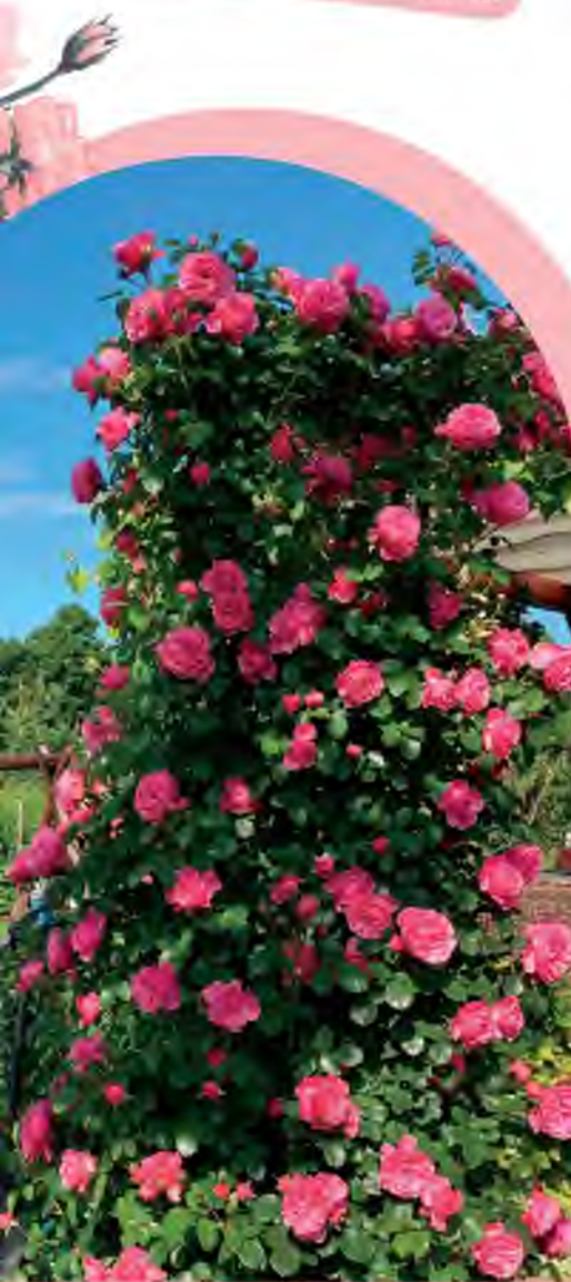
Rosa 'Da Vinci' édesapám által készített rózsafuttató kapun