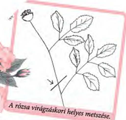
A rózsza virágzóskori helyes metszése.

kertészmérnök, kertépítő-, és zöldfelület fenntartó szakmérnök