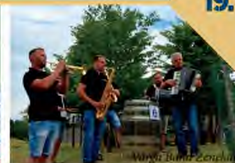
Wiggy Band Zenehu