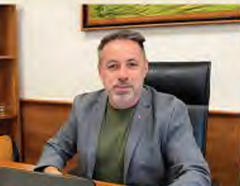
INTERJÚ - BUKODI KÁROLY POLGÁRMESTER 8-9. OLDAL

ÓCSA VÁROS ÖNKORMÁNYZATÁNAK INGYENES LAPJA