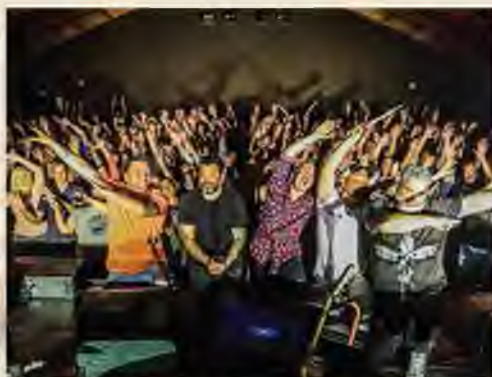
46. ÓCSAI KULTURÁLIS NAPOK 16. OLDAL