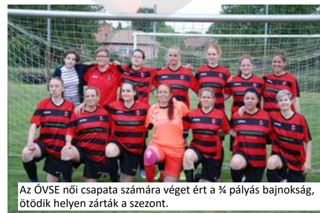
Az ÓVSE női csapata számára véget ért a ¼ pályás bajnokság, ötödik helyen zárták a szezont.

gólokra nem mindig tudjuk beváltani a szép megmozdulásokat. A focit márpedig gólról játszzák. Úgy gondolom, hogy hét csapat alpból nagyon kevés egy bajnokságban, még hozzá abból három-négy olyan, akiknek erősebb bajnokságban lenne a helyük. A legtöbb meccsünk így hát a papírforma szerint alakult, de reméljük, jövőre tudunk majd meglepetéseket okozni az ellenfeleinknek! A bajnokság végeztével tudunk csak a fut-salra koncentrálni, ahol az utolsó fordulóban az első helyért küzdünk. Hajrá Ócsa!