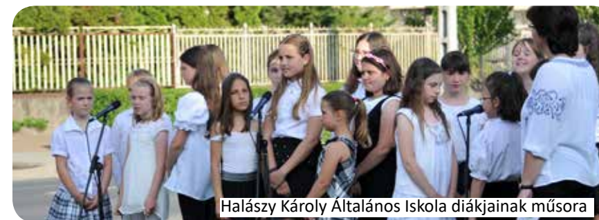
Halászy Károly Általános Iskola diákjainak műsora