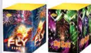
Fly Fire 16 lövéses tűzijáték 304g F2 Sky Stars 16 lövéses tűzijáték 304g F2 Kaliber: 30 5500 Ft/db