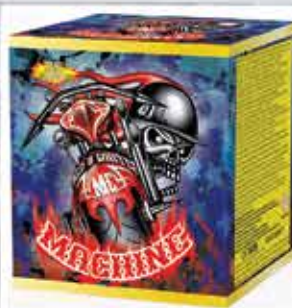
Machine 25 lövéses tűzijáték 187,5g F2 Kaliber: 20 4100 Ft/db