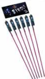
Sikoly rakétacsomag tűzijáték 5,2 g F2 250 Ft/csomag