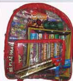
Pyro hátizsák 3100 Ft/db

Az újságban szereplő akció 2020.12.01-től 2020.12.31-ig érvényes.