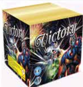
Victory 49 lövéses tűzijáték 368,5 g F2 Kaliber: 20 8800 Ft/db