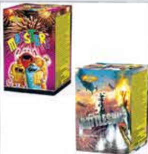
Monster 16 lövéses tűzijáték 120g F2 Battleship 16 lövéses tűzijáték 120g F2 Kaliber: 20 2800 Ft/db