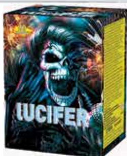
Lucifer 20 lövéses tűzijáték 150 g F2 Kaliber: 20 3200 Ft/db