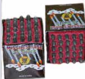
Katyusa 25 lövéses tűzijáték 120g F2 500 Ft/db