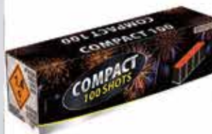
Compact 100 lövéses tűzijáték F2 Kaliber: 30 52000 Ft/db