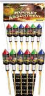
Rakétacsomag tűzijáték 99 g F2 3800 Ft/csomag