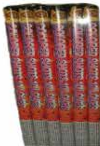
Római gyertya 10 lövés 12 g F2 280 Ft/db