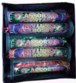
Szikra szökőkút tűzijáték 90 g F2 1400 Ft/db

Ingyenes kiszállítás 5000Ft feletti rendelés esetén Ócsa és Alsópakony egész területére.