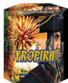
Pyropirate 19 lövéses tűzijáték 227,5 g F2 Kaliber: 25 5200 Ft/db