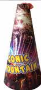
Vulkán tűzijáték 200 g F2 2400 Ft/db

Ingyenes kiszállítás 5000Ft feletti rendelés esetén Ócsa és Alsópakony egész területére.