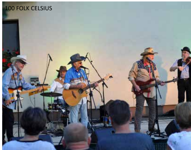
100 FOLK CELSIUS