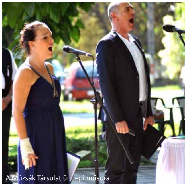
A Múzsák Társulat ünnepi műsora