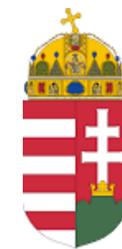
Magyarország Kormánya AGRÁRMINISZTERIUM