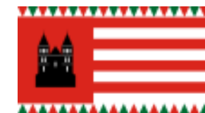
Ócsa város Önkormányzata