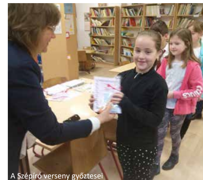
A Szépíró verseny győztesei