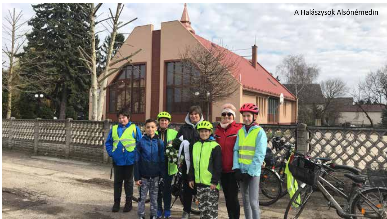
A Halászy Napok Alsónémedin