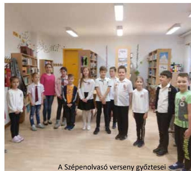
A Szépenolvasó verseny győztesei