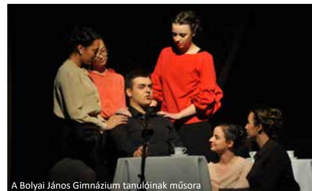
A Bolyai János Gimnázium tanulójának műsora