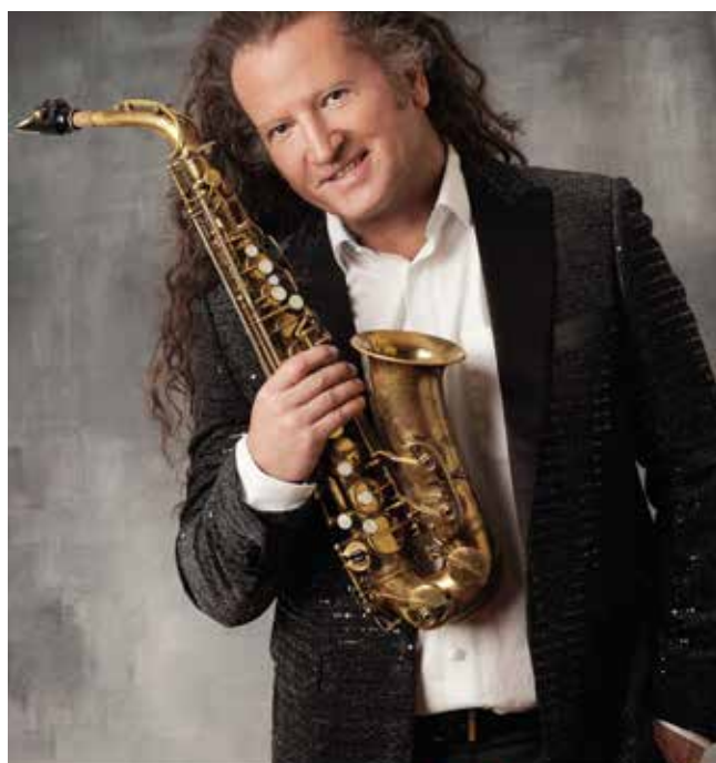
ST. MARTIN ADVENTI ÉLŐ KONCERT 2019. DECEMBER 22. 16.00 ÓRA

EGRESSY GÁBOR SZABADIDŐKÖZPONT 2364 ÓCSA, Bajcsy-Zs. u. 46-48. Tel.: 06 29 378043 WWW.OCSAMUVHAZ.HU