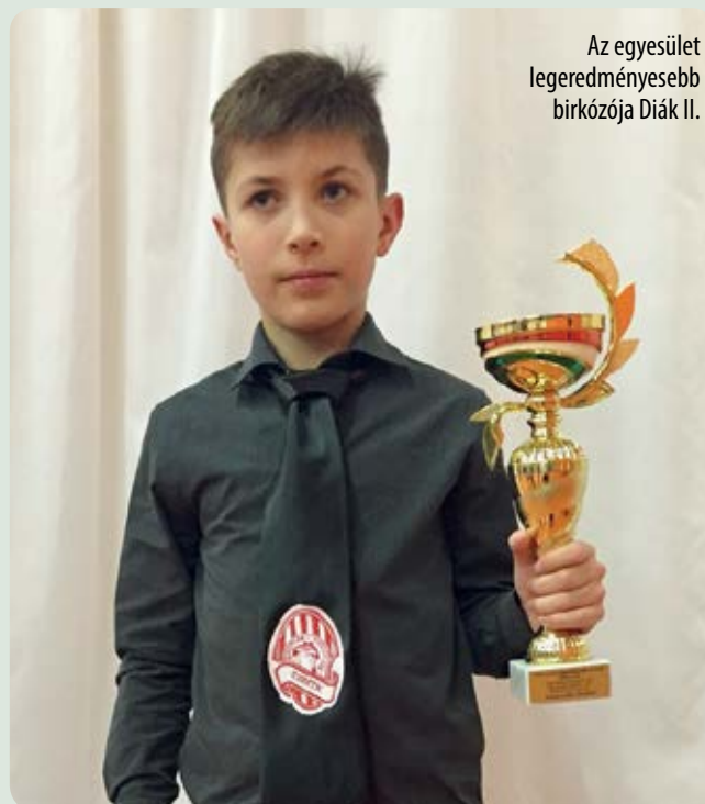
Az egyesület legeredményesebb birkózója Diák II.

Ahhoz kell, hogy egy erősebb ellenfelet is le tudjon győzni az ember. Például ki kell húzni az időt a végéig. Tudni kell előre gondolkodni, villámgyorsan reagálni az ellenfél akcióira. És persze az edző utasításait is meg kell hallani és követni azokat.