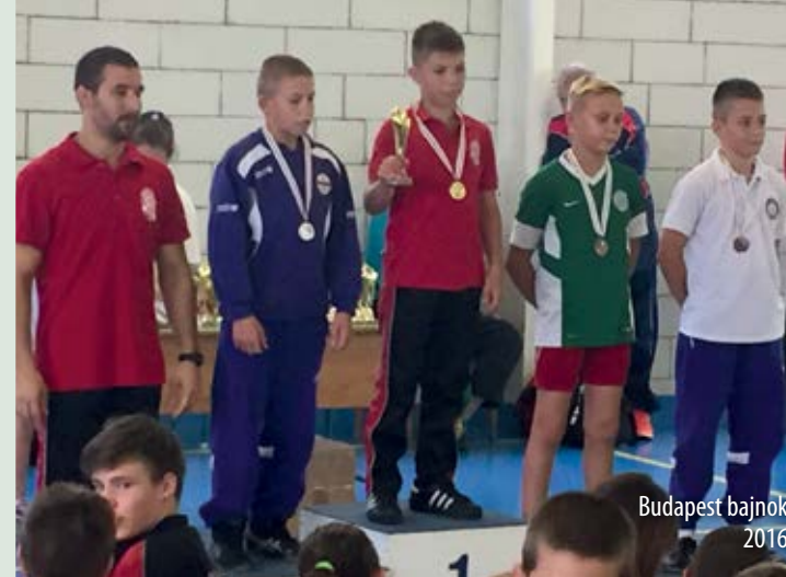
Budapest bajnok 2016

Zsolti említette, hogy Te viszed őt edzésre. Ez napi elfoglaltság neked is, nem kevés teher. Mégis vállalod. Mit