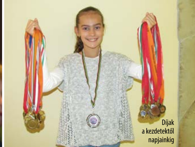
Díjak a kezdetektől napjainkig