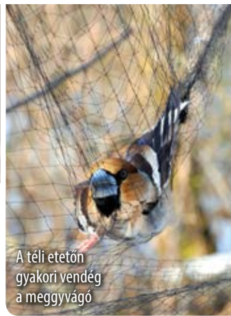
A téli etetőn gyakori vendég a meggyvágó