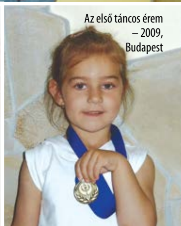
Az első táncos érem – 2009, Budapest