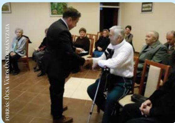
FORRÁS: ÓCSA VÁROS ÖNKORMÁNYZATA

A Pest Megyei Kormányhivatal közleménye szerint: 2015. júlistól megváltozott a hadigondozotti ellátásra jogosultak köre, az erről szóló igényléseket a járási hivatalokhoz nyújthatják be az érintettek. A törvénymódosításnak köszönhetően a második világháborúban elesett, eltűnt és hadifogságban elhunyt katonák árváinak anyagi támogatás állapítható meg mely a legkisebb öregségi nyugdíj 30 %-a 8850 Ft, amely egyfajta nyugdíj kiegészítés. A jogosultak ezen túlmenően alanyi jogon részesülnek közgyógyellátásban.