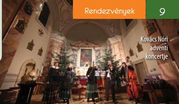
Kovács Nóri adventi koncertje