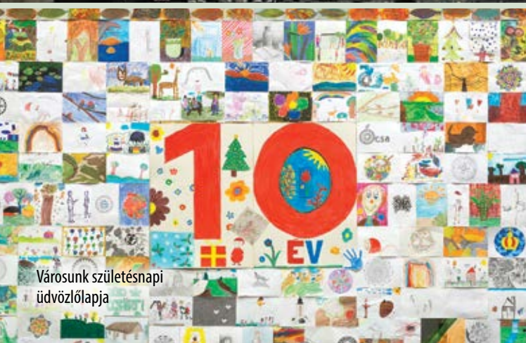
Városunk születésnap üdvözlőlapja

Az ünnephez kapcsolódva ebben az évben is megrendeztük a cipősdoboz gyűjtést.