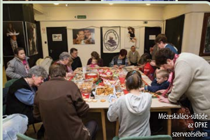
Mézeskalács-sütőde az OPKE szervezésében