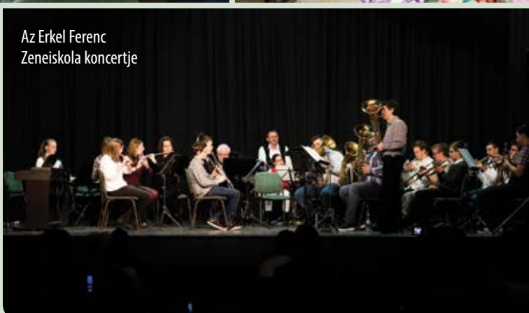
Az Erkel Ferenc Zeneiskola koncertje

Fények, mosolyok, illatok. Jó volt együtt lenni, találkozni, egy bögre forralt bor mellett beszélgetni.