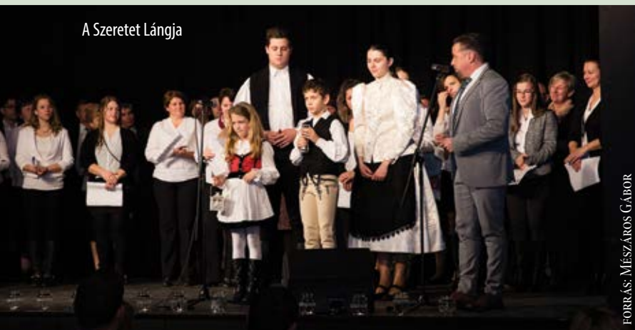
A Szeretet Lángja