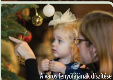
A város fényőfájának díszítése