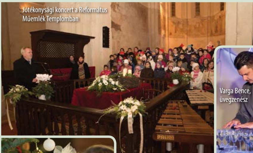
Jóteknysági koncert a Református Műemlék Templomban