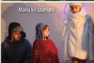
Mária kis számará