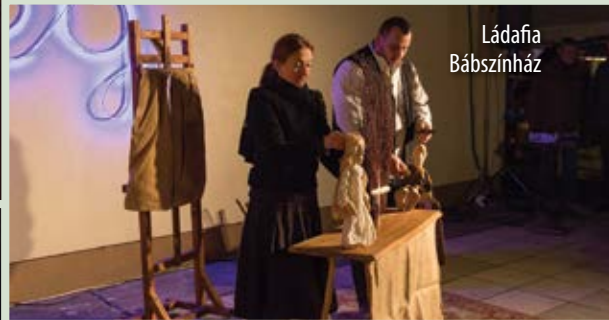
Láda fia Bábszínház