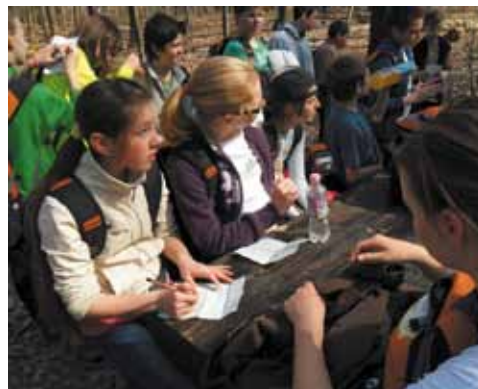
Halászy Károly Általános Iskola

és hogyan kell, illetve lehet hivatalos ügyeket intézni, mi a feladata az önkormányzat különböző osztályainak. A gyerekek nagyon élvezték, hogy az átadott ismeretek nem száraz adatokból álltak, hanem hétköznapi példákon keresztül bemutatva egy kis humorral fűszerezve interaktív előadáson vehettek részt.