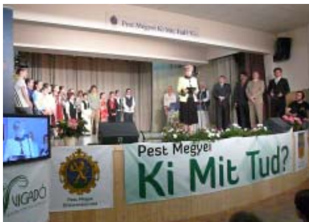
A győztesek jutalma: Balatoni táborozás és fellépés a Summerfesten