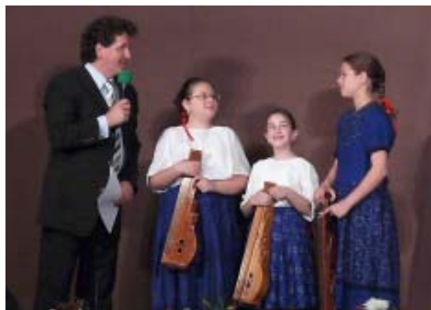
Citeratrió – Pest megye különdíjasai