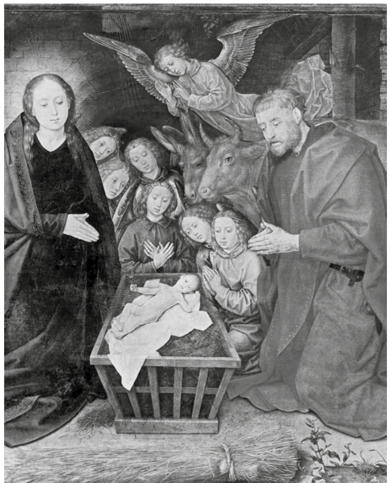
Hugo van der Goes: A pásztorok imáddása Betlehemben

Vannak olyan rászorulóknak, akiket nem ilyen könnyű észrevenni, mert hozzájuk nem elég a testi szemünk. Őket lelki szemünkkel tudjuk csak látni, mert nem fizikai segítségre szorulnak, hanem lelkileg szegények, mentálisan rászorulóknak. Nekik nem ruhára van szükségük, hanem egy mosolyra, egy ölelésre. Nem testi táplálékra, hanem egy bátorító jó szóra. És ez számukra többet jelent bármilyen kézzelfogható támogatásnál. Nos, itt az