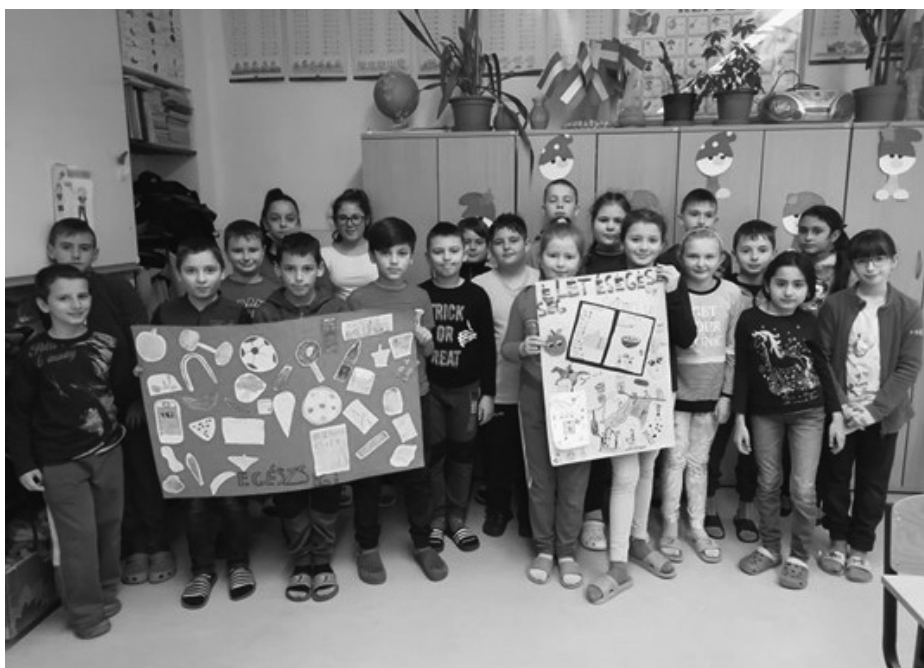
Egészségnap a negyedik osztályban

Iskolánkat Csókási Blanka képviselte a makói online versenyen az 1. osztályos