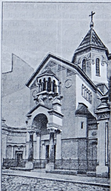
Az új örmény templom Párisban.