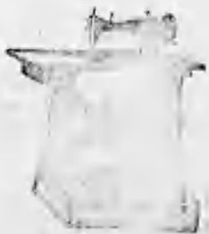
A vidék le nagyobb varrógép raktára. A legtokéletesebb kivétel 8 évi jótállás.