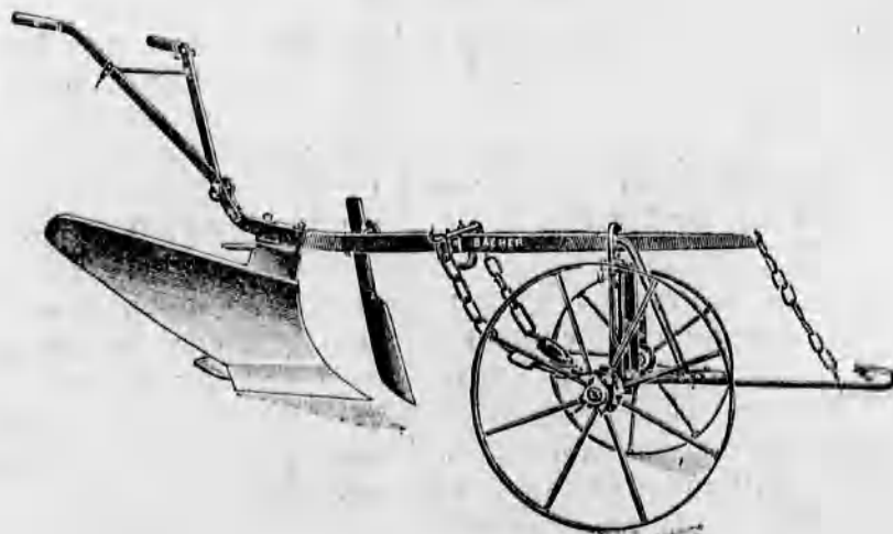
Szakekék minden nagyságban már 48 korona. tól kezdve.