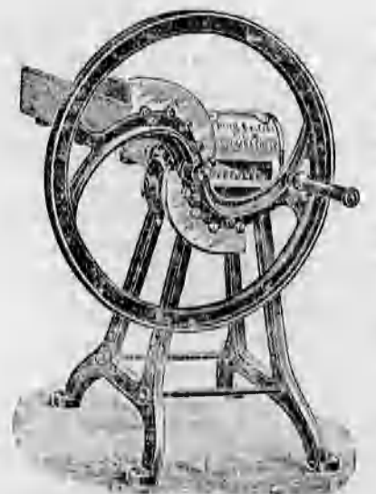
Különféle szecskavágók. 44 koronától feljebb.