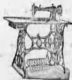
A vidék raktára kivétel varrógép tesebb allas.