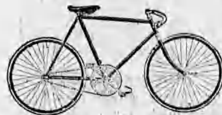
A legalkalmasabb kerékpárok. A Pre nier gépek egyedarsítása.