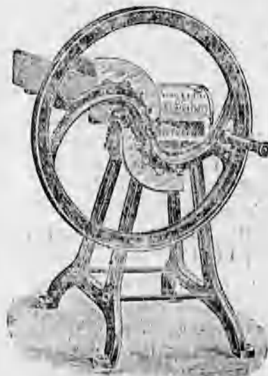
Különféle szecskaavágó 44 koronától feljebb.